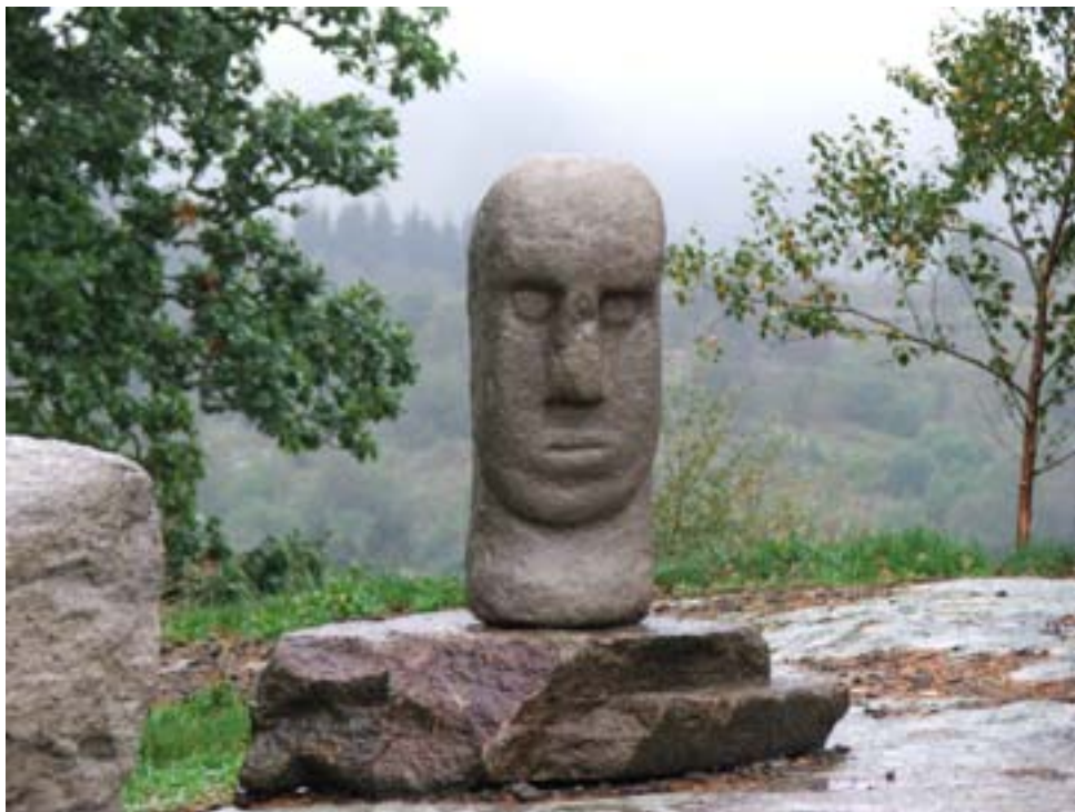
Rosslandsguden i Sokndal, Rogaland.

Mange av prosjektene tar utgangspunkt i kulturminner fra nyere tid, men også arkeologiske kulturminner har fått plass i Kulturminneåret. Helleristningsfeltet på Ausevik i Flora, Sogn og Fjordane, nevnt i forrige nyhetsbrev fra Forvaltningsgruppa, er et av fyrtårnprosjektene til Riksantikvaren i Kulturminneåret. Her vil det påbegynte arbeidet med å tilrettelegge feltet for publikum med bl.a. skilting og gangstier fortsette for fullt. Flere av kulturminneløypene har også utgangspunkt i tematikk fra forhistorien. Et eksempel på dette er "I Rosslandsgudens rike" i Sokndal, Rogaland. Rosslandsguden er et steinhode som ble funnet på Rossland på begynnelsen av 1700-tallet (se foto). Hodet lå i en ur like nedenfor et oppbygd steinalter som står på et høydedrag sentralt i bygda. Kulturminneløypa tar utgangspunkt i stedet med gudehodet og alteret, og guider deg videre rundt til ulike severdigheter og fortidsminner i området. Løypa er laget av Dalane friluftsråd i samarbeid med Sokndal kommune. I arbeidet med kulturminneløyper i Sogn og Fjordane har en også hatt fokus på arkeologiske kulturminner, bl.a. kvernsteinsbruddet i Hyllestad. Arbeidet med disse løypene er et samarbeid mellom det offentlige og frivillige lag/organisasjoner.